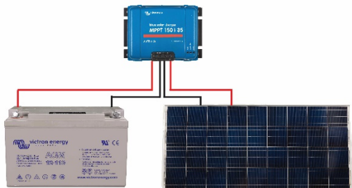
Figure 1: Power connections