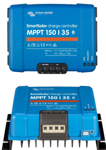
SmartSolar Lade-Regler MPPT 150/35