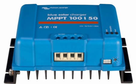
Solar-Laderegler MPPT 100/50